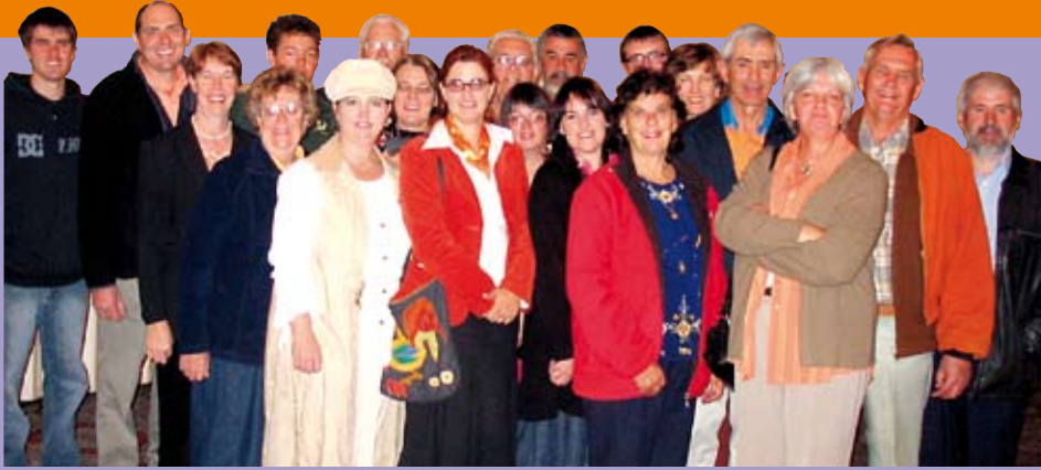
Die afvaardiging wat die aansoek vir 'n uitsaailisensie vir Radio Orania aan Okosa voorgelê het.