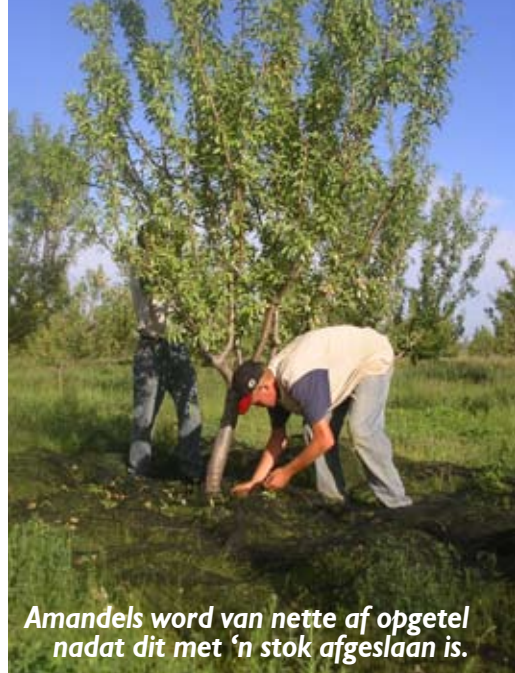
Amandels word van nette af opgetel nadat dit met 'n stok afgeslaan is.